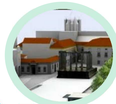
Fundação Eugénio de Almeida Evora