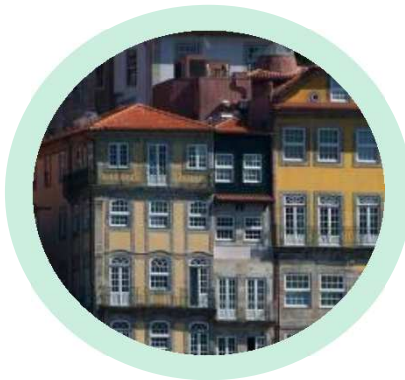
Praça da Ribeira Porto