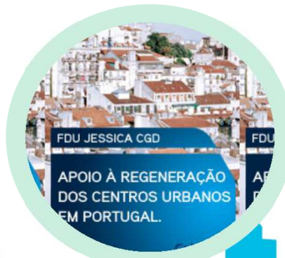
Fundo Cidades de Portugal Coimbra