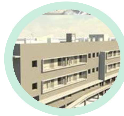
Residência para 3ª Idade Trofa