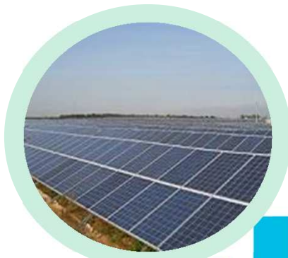
Energia renovável Évora