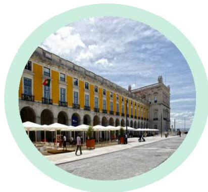
Terreiro do Paço Lisboa