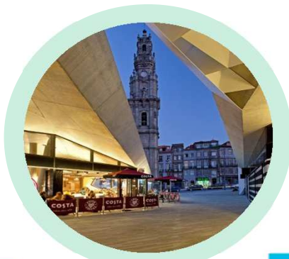
Passeio dos Clérigos Porto